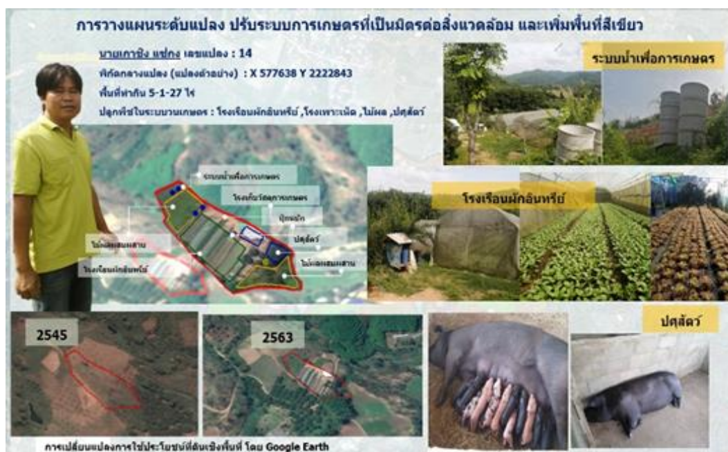
ตัวอย่างการใช้ประโยชน์ที่ดินของนายเกษิง แซ่กง เกษตรกรผู้นำ

โดยมีรายได้รวมสูงขึ้นอย่างต่อเนื่อง คิดเป็นร้อยละ 59.67 ของรายได้ทั้งหมด หรือมูลค่า 3,380,677 บาท ขณะที่ไม้ผลและไม้ยืนต้นอื่นๆ เริ่มสร้างรายได้ให้กับเกษตรกร เช่น กาแฟ องุ่น เสาวรสหวาน และหวาย คิดเป็นร้อยละ 37.13 ของรายได้ทั้งหมด หรือมูลค่า 2,103,340 บาท ในปี 2560 มีสมาชิกผู้ปลูกผักอินทรีย์จำนวน 9 ราย เพิ่มเป็น 24 รายในปี 2564 ผ่านการรับรองมาตรฐานอินทรีย์จำนวน 22 ราย จำนวน 39 โรงเรือน พื้นที่ 10.4 ไร่ และมีเกษตรกรที่ได้รับรองมาตรฐาน GAP จำนวน 9 ราย พื้นที่ 15 ไร่